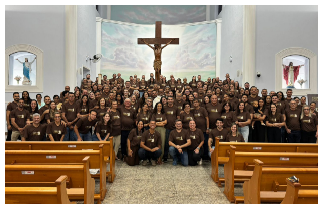
26 04 Primeira tarde pra casais da Paróquia Sagrado Coração de Jesus, em Jussara.