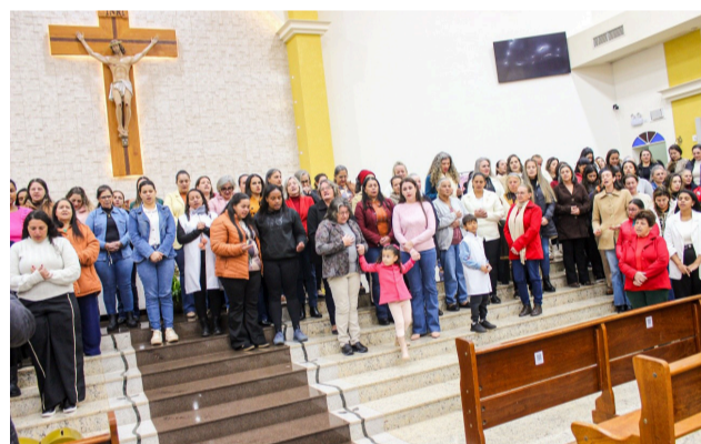
10 05 Bênção para as mãe na Paróquia Santa Teresinha do Menino Jesus e da Sagrada Face, em Campina da Lagoa.