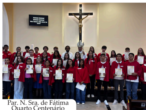
Par. N. Sra. de Fátima Quarto Centenário

crismandos. Em clima de oração e emoção, jovens e adultos recebem a unção com o óleo do Crisma, renovando as promessas batismais e assumindo, de forma mais consciente, sua vocação de discípulos missionários de Jesus Cristo.