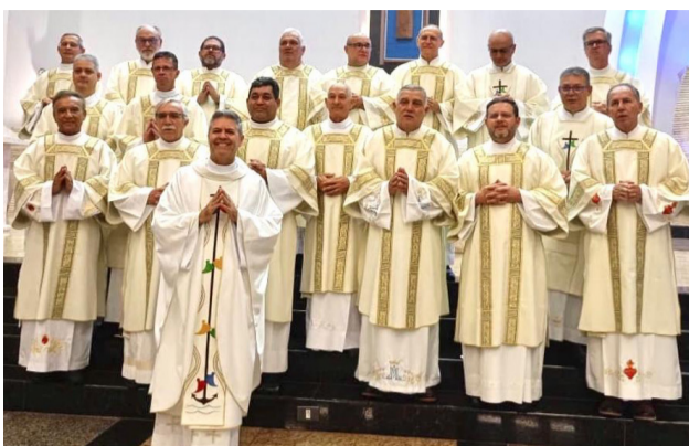
26 04 Encontro dos diáconos permanentes na Paróquia Nossa Senhora das Candeias, em Goioerê.