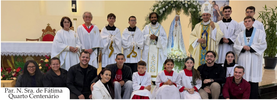
Par. N. Sra. de Fátima Quarto Centenário