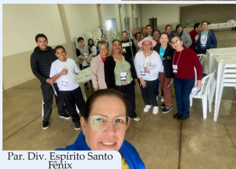
Par. Div. Espírito Santo Fênix

aproximar-se das pessoas em sua realidade concreta, levando presença, Palavra e oração. O manual missionário também destaca três atitudes fundamentais para a visita às famílias: presença, escuta e reverência.