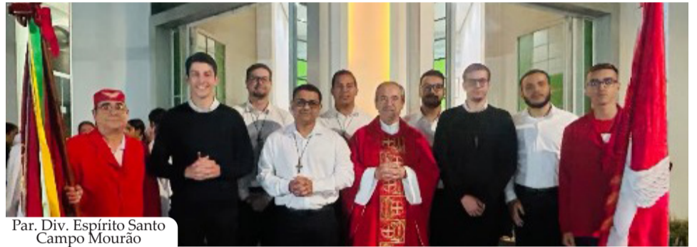
Par. Div. Espírito Santo Campo Mourão