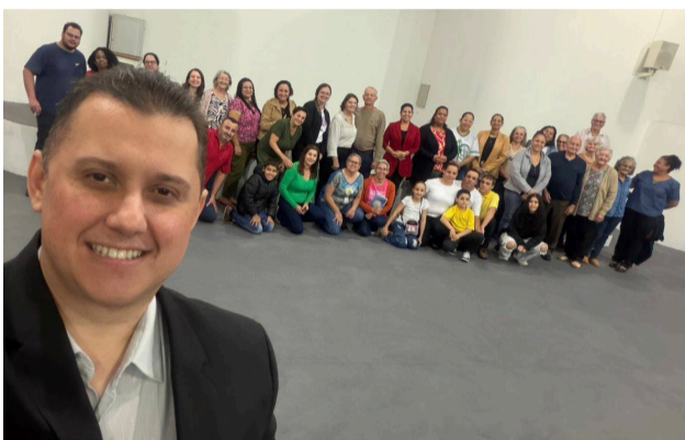
02 05 Formação missionária na Paróquia São Gabriel e São Sebastião, em Ivailândia.