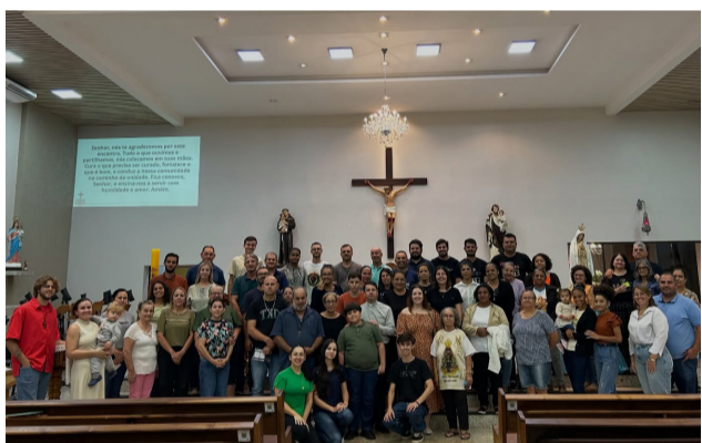
07 05 Reunião do Conselho Pastoral Paroquial (CPP) na Paróquia Santo Antônio, em Farol.