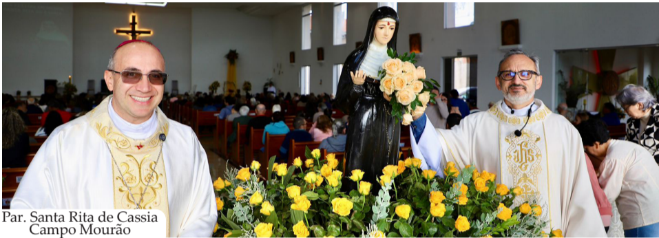
Par. Santa Rita de Cassia Campo Mourão