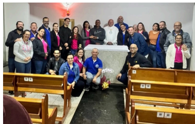
06 05 12º Retiro de Casais na Paróquia Nossa Senhora das Graças, em Engenheiro Beltrão.