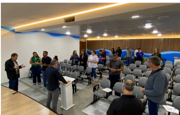
08 05 Reunião do Conselho Pastoral Paroquial (CPP) na Paróquia Santuário Nossa Senhora Aparecida, em Campo Mourão.