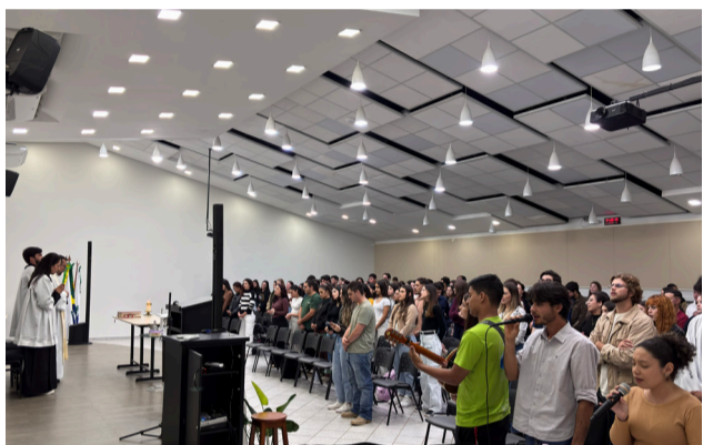
27 04 Missa com universitários no Integrado Campus, em Campo Mourão.