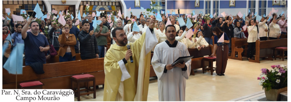
Par. N. Sra. do Caravaggio Campo Mourão