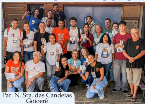
Par. N. Sra. das Candeias Goioerê

O subsídio preparado para os missionários recorda que “a missão pertence à própria identidade da Igreja” e reforça que evangelizar é