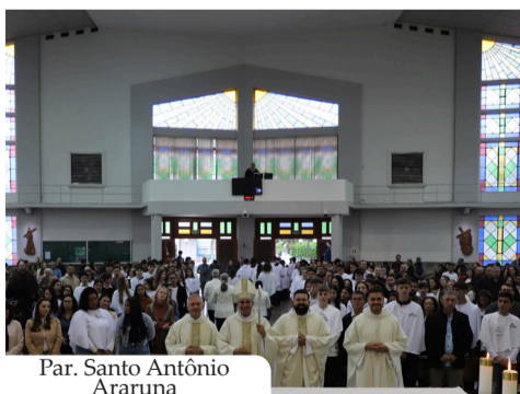
Par. Santo Antônio Araruna