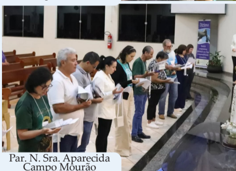
Par. N. Sra. Aparecida Campo Mourão

gem de Nossa Senhora de Fátima tem despertado emoção, reencontros com a fé e momentos de profunda espiritualidade.