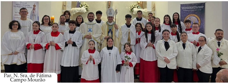
Par. N. Sra. de Fátima Campo Mourão