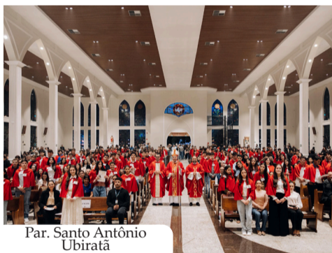
Par. Santo Antônio Ubiratã

As celebrações têm sido marcadas pela participação expressiva das famílias, padrinhos, catequistas e membros das comunidades paroquiais, que acompanham com alegria este passo importante dos