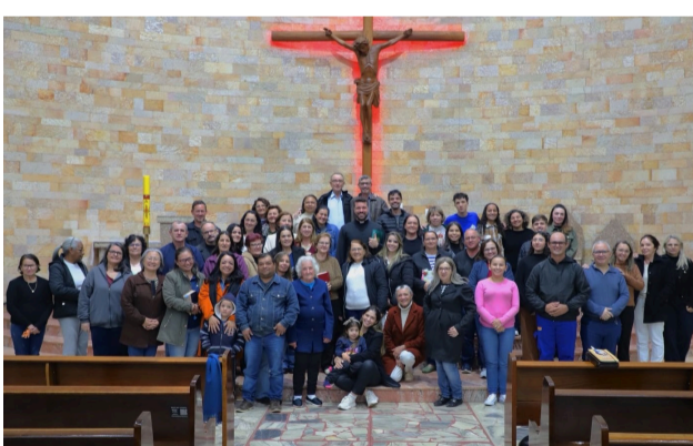
13 05 Espiritualidade para coordenadores e servos dos grupos de oração na Paróquia São Judas Tadeu, em Terra Boa.