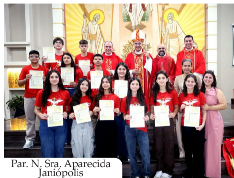
Par. N. Sra. Aparecida Janiópolis